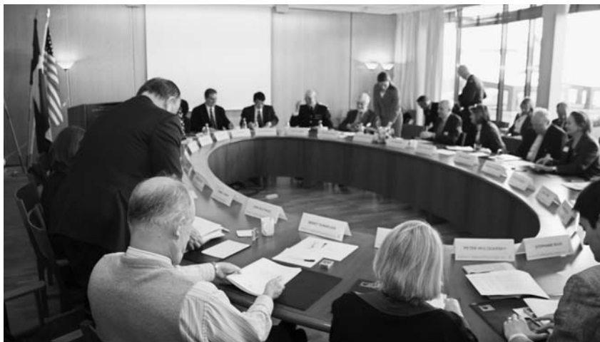
Seminarieret gick av stapeln på Utrikespolitiska institutet.