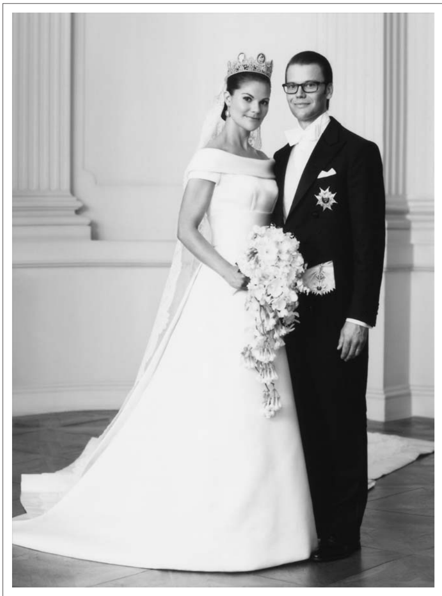
Stiftelsens hedersordförande Kronprinsessan Victoria och Prins Daniel på bröllopsdagen 19 juni 2010.