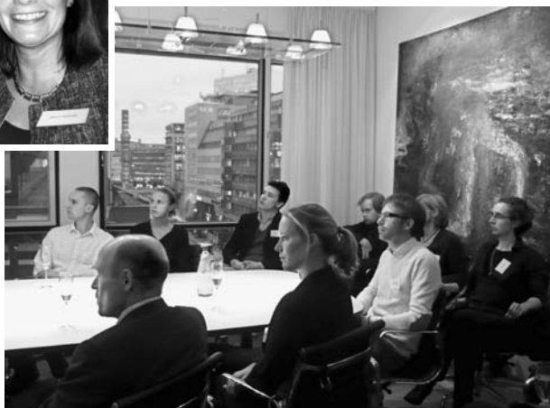
Gäster på Homecoming 2010.