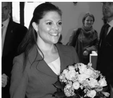
Stiftelsens hedersordförande HKH Kronprinsessan Victoria.